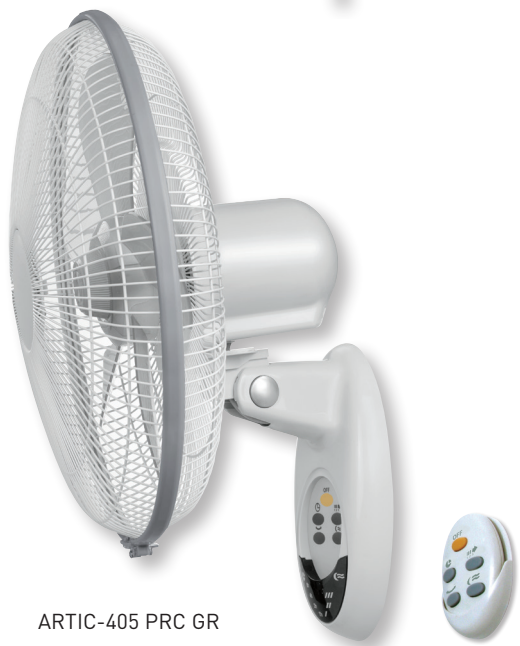
ARTIC-405 PRC GR

Настенные вентиляторы ARTIC PM/PRC GR обладают низким уровнем шума, имеют три скорости вращения и таймер.