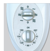
Artic 405 PM GR Переключатель скоростей и таймер.